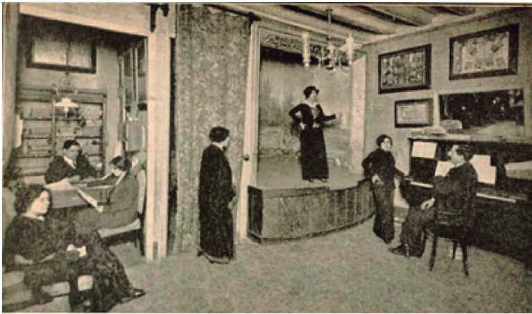
FIGURA 6. Interior de l'Acadèmia Ribé de Barcelona, al carrer Conde del Asalto, 28, 1r (1914).

Malgrat que sigui d'una època anterior, la imatge següent de l'interior d'una acadèmia d'aquest estil és il·lustrativa del treball que s'hi feia. Hi figura un pianista, segurament alhora compositor, ja que anuncien «Couplets nuevos cada semana» i també un petit escenari per simular la realitat de l'espectacle. Anuncien: «Salón con escenario para aprender prácticamente». També hi ha unes estudiants esperant-se i repassant potser la lletra d'alguna cançó del seu repertori i un personatge darrere el taulell atenent o portant el control de l'activitat.